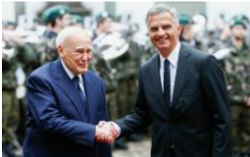
Präsident Papoulias wird von Bundespräsident Burkhalter auf dem Landgut Lohn bei Kehrsatz empfangen.

Bundespräsident Didier Burkhalter empfing den griechischen Staatspräsidenten Papoulias am 2. Mai zu einem offiziellen Besuch in Bern. Im Zentrum der Gespräche standen die bilateralen Beziehungen sowie europapolitische Themen. Vor dem Hintergrund der griechischen EU-Ratspräsidentschaft erläuterte der Bundespräsident seinem Amtskollegen Karolos Papoulias insbesondere die vom Bundesrat geplanten nächsten Schritte im Verhältnis Schweiz-EU.