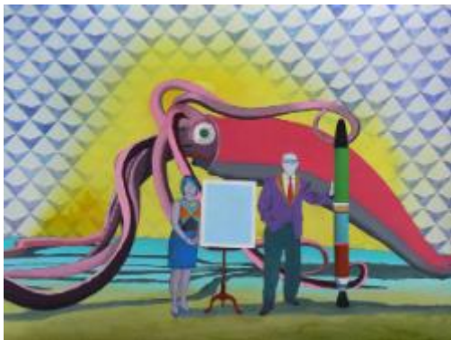
They Endorsed Collective Failure as the Dawn of a New Renaissance, 2013 Acrylic, spray paint and watercolor on paper.

State of Concept, la première galerie à Athènes à but non lucratif, sera l'hôte de la première exposition solo de l'artiste visuel suisse, Basim Magdy. L'exposition se concentrera sur le travail de Magdy au cours des dernières années.