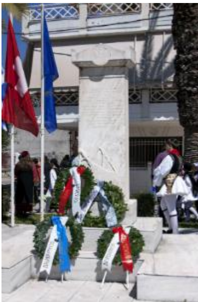
Denkmal in Mesolongi zu Ehren des Schweizer Philhellenen Johann Jakob Meyer