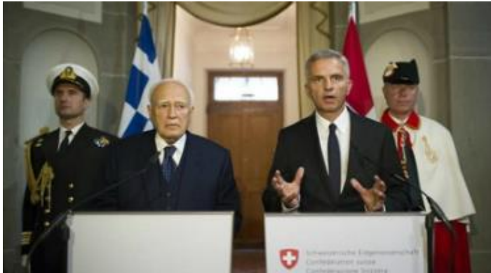
Conférence de presse des présidents Didier Burkhalter et Karolos Papoulias, 2 mai 2014 au manoir du Lohn près de Berne. Συνέντευξη τύπου των Προέδρων Didier Burkhalter και Κάρολου Παπούλια, 2 Μαΐου 2014 στο μέγαρο του Lohn κοντά στη Βέρνη